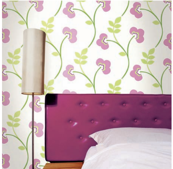
Exemple de papier peint à raccord. DR Initiales.

On conseille en général d’ajouter 10 cm à la marge déjà prévue pour les arasements, mais tout dépend de la taille des motifs. Démarrez le haut du premier lé (contre le plafond) par un motif entier, de façon à araser au niveau de la plinthe, là où la coupe est moins visible.